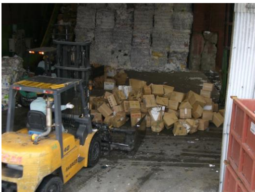
到着後すぐに荷降ろし、投入作業を行う