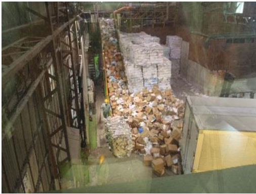
ベルトコンベアーでダンボールごと溶解槽へ