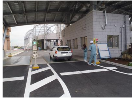
クリーンランドの協力を得て計量

投入完了後、製紙原料となり その後トイレットペーパーに 生まれ変わる。 ..... 計量証明書と溶解証明書を発行