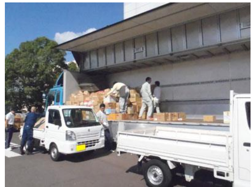
運搬のトラックに積み込み