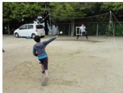
スピードガン測定の様子

刀根山地域子ども教室主催のイベントに参加しました。柴原体育館は、投げたボールをスピードガンで計測するブースを担当し、子どもたちに挑戦してもらいました。そして、とよピヨと刀根山小学校区の子どもたちと一緒にとよピヨ体操も実施しました。