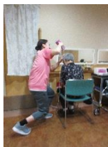
施設でのドライヤーかけの様子

ボランティア活動にすこし興味があるけどどうやってはじめてほしいのかわからないひと、いつも通る道の施設で社会貢献してみたいひと、このプログラムを利用してボランティアをはじめませんか。豊中市社会福祉協議会ボランティアセンターは、この夏、皆さんのいろいろな出会いを応援します。