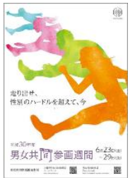
2018年度の男女共同参画週間ポスター