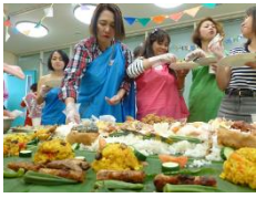
5月に開催したフィエスタの様子

とよなか国流に寄せられる相談件数の内、約半数がフィリピン人からの相談です。豊中市には約200人のフィリピン国籍の人がいますが、日本人の配偶者がいる(もしくはいた)方が多く、老後に不安を抱く人も少なくありません。とよなか国際交流センターでは、フィリピン人中老年の居場所づくり事業として「Filipino Young at Heart's Club」を昨年度から毎月1回開催しています。