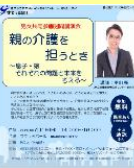
すてっぴ講演会チラシ

親が要介護になったとき、子どもだけで介護を担うのは負担が大きすぎますし、介護を終えた後の生活も考えなければなりません。息子と娘で共通する課題や異なる課題を整理し、個人や社会がどう対応すればよいのかを考えます。