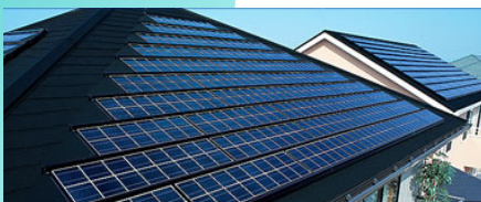
住宅用ソーラー発電システム