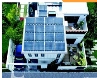
太陽光発電を設置している住宅 （セキスイハイムカタログより）