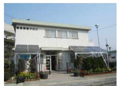
豊島公園 環境情報サロンに設置した太陽光発電 （しみん共同発電事業実行委員会による設置）