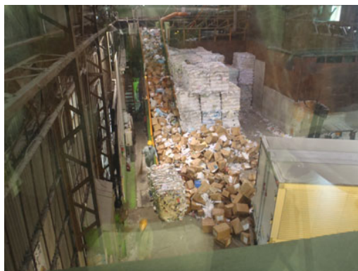
ベルトコンベアーでダンボールごと溶解槽へ