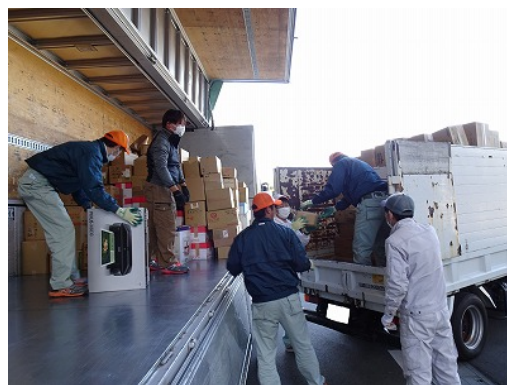
運搬のトラックに積み込み