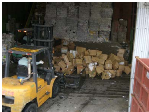
到着後すぐに荷降ろし、投入作業を行う