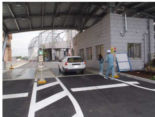
クリーンランドの協力を得て計量