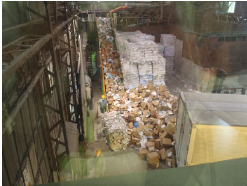
ベルトコンベアーでダンボールごと溶解槽へ