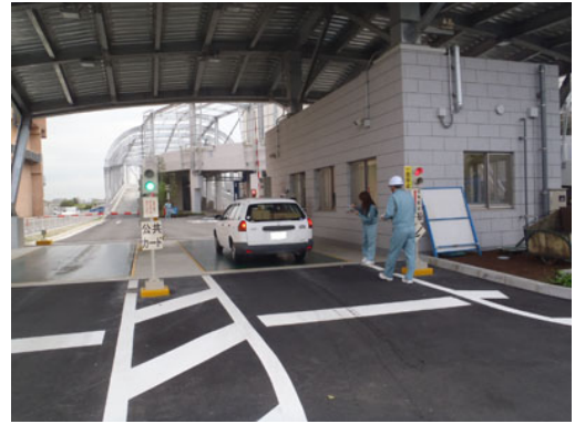
クリーンランドの協力を得て計量

投入完了後、製紙原料となり その後トイレットペーパーに 生まれ変わる。 ..... 計量証明書と溶解証明書を発行