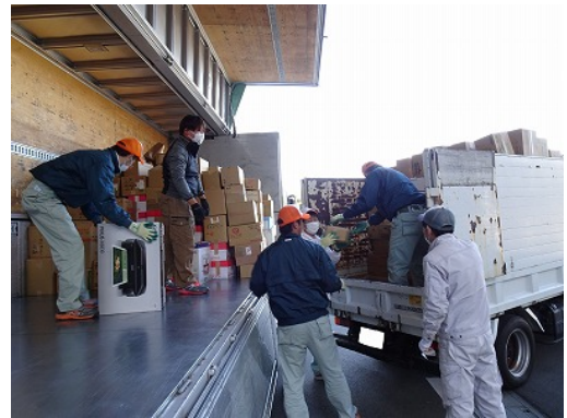
運搬のトラックに積み込み