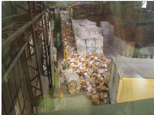
ベルトコンベアーでダンボールごと溶解槽へ