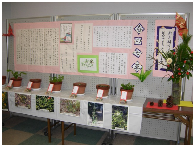
七草展示の様子（くらしかん）