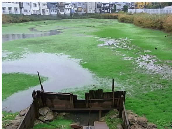
赤坂下池 (柴原町5丁目) 2012年11月撮影