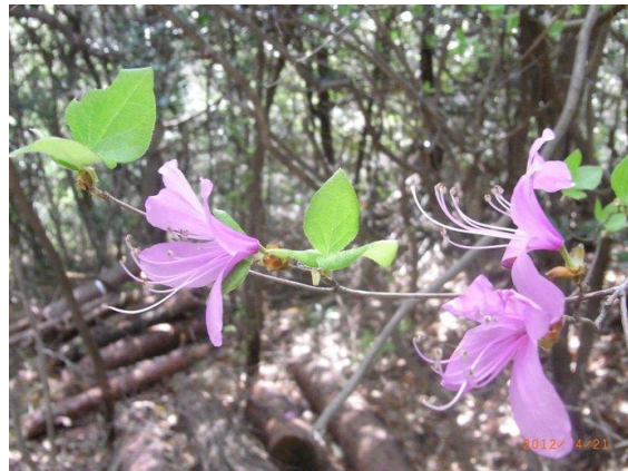
コバノミツバツツジ (島熊山緑地)

“兎追いしかの山、小鮒つりしかの川”と歌われますが、ひと昔前は豊中の産業は農業が中心でした。街から少し出ると自然があり、子どもたちは学校から帰ると、陽が暮れるまで外で遊んでいました。