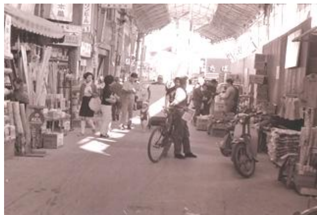
昭和44年 桜塚商店街風景