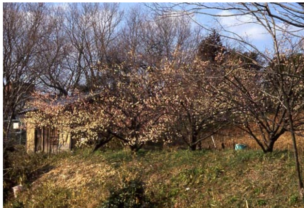
かつての熊野田付近の一風景