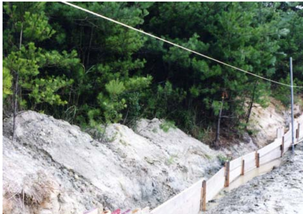
開発が進む島熊山周辺