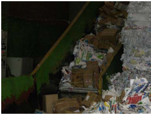
ベルトコンベアーでダンボールごと溶解槽へ