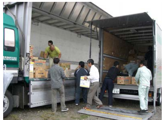
運搬のトラックに積み込み