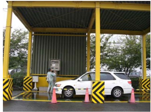
クリーンランドの協力を得て計量

投入完了後、製紙原料となり その後トイレットペーパーに 生まれ変わる。 ..... 計量証明書と溶解証明書を発行