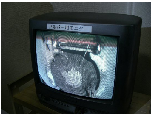
モニターで溶解のようすを確認