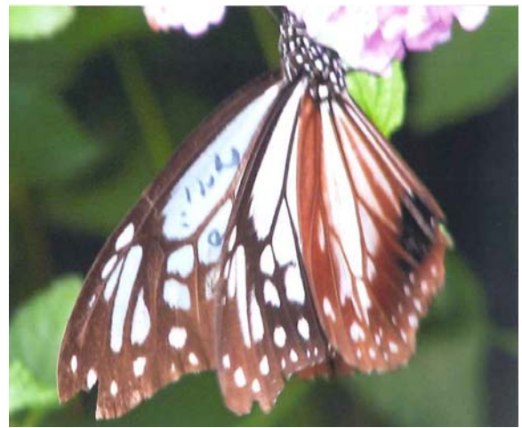
アサギマダラ(マーキングされている) 刀根山6丁目

2009年度に引き続き、今年はデータの少なかった豊中市南部を重点に実施します。カメラを通して豊中の“むし”を発見し、豊中の自然に親しみませんか。“むし”から自然のおもしろさ、ふしぎさを再発見いたしましょう。どうぞご参加ください