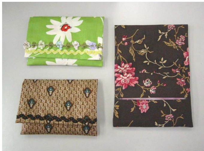
ティッシュケースを開いたところ